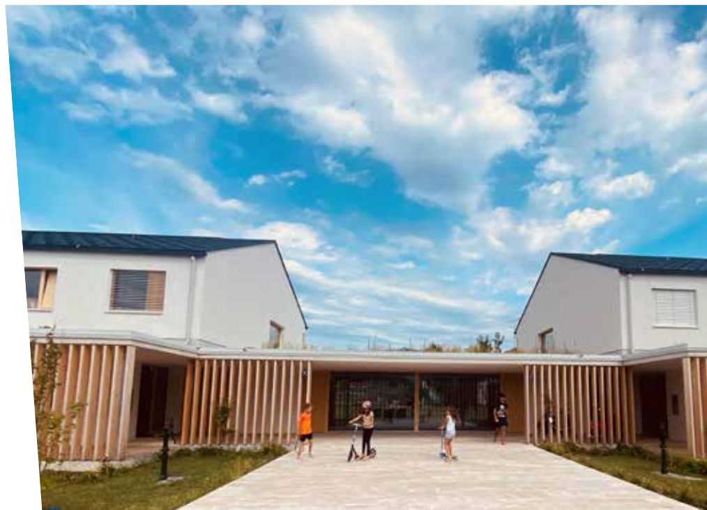
Familiäre Wohngruppen in Wolfurt 2023

Kinder, die nicht mehr in ihrer Herkunftsfamilie leben können, brauchen zuallererst Schutz, Halt und eine vertrauensstiftende Umgebung. „Sie bringen einen großen Rucksack an belastenden Erfahrungen mit. Oft sind die Kinder sozial auffällig und verhalten sich nicht erwartungsgemäß. Gerade dann ist es wichtig, sie mit ihrer Biografie zu verstehen – mit allem, was sie ausmacht – und sie so anzunehmen, wie sie sind.“ Feinfühligkeit, Empathie und ein ehrlich gemeintes Beziehungsangebot seien gefragt, denn für alle Kinder bedeute die Fremdunterbringung eine große Kränkung. „Die Trauer über die Trennung