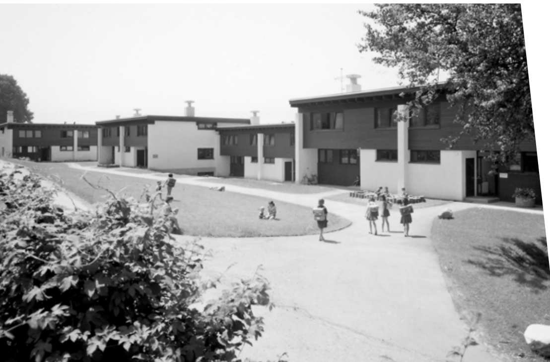
Kinderdorf Kronhalde in Bregenz 1976